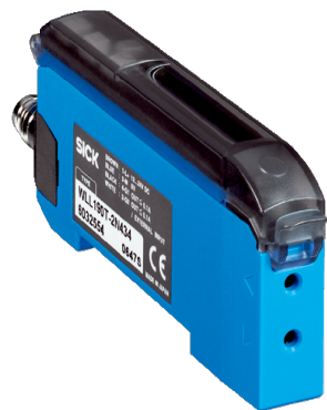
Изображения могут отличаться от оригинала